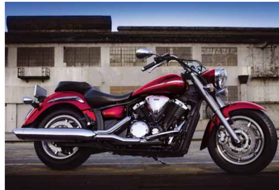
Paweł Barć Źródło: Mitsui Motor Polska Sp. z o.o.

Natomiast bardziej wprawni motocykliści docenią komfort podróżowania we dwoje, wygodną pozycję kierowcy oraz niesłychaną łatwość pokonywania zakrętów. Nowy motocykl Yamaha XV51300A Midnight Star dostępny jest w salonach dealerskich Yamaha na terenie całego kraju. Jego cena to 45 500 zł.